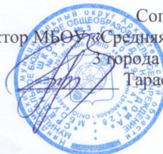
График работы родительского контроля за организацией горячего питания 2023 – 2024 учебный год.